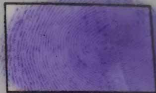
Left thump impression